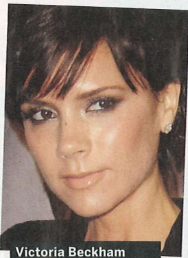
Victoria Beckham traîne toujours la crème Eight Hour avec elle.